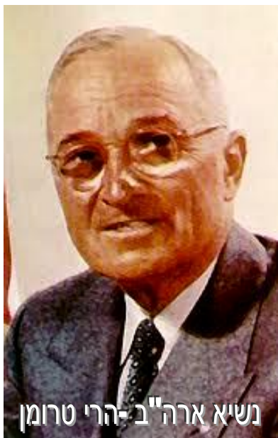
נשיא ארה"ב - הרי טרומן

אבל כמובן שהחלק הרגשי הזה לא היה עומד מול האחריות כלפי האינטרסים של אמריקה והיה אסור לי לעשות זאת. למה בכל זאת הוריתי לשגריר להצביע עבורכם?